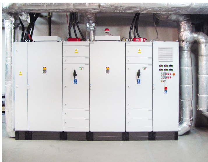
Rozdzielnica z kaskadą dwóch napędów 400 kW