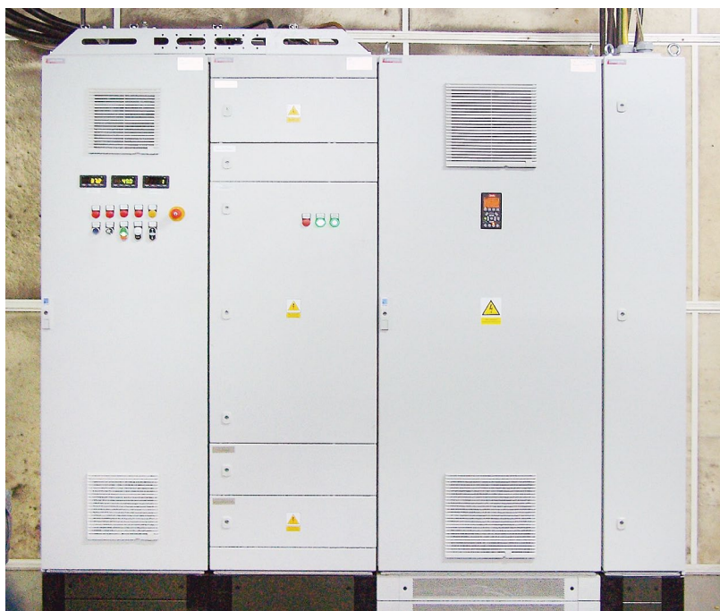
Rozdzielnica z przetwornicą częstotliwości Danfoss FC102P400K